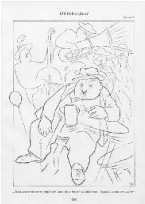
"Oktoberfest", Zeichnung von Karl Arnold, Simplicissimus, 35. Jahrgang Nr. 26, 1930

Der Spießler ist bekanntlich ein hypochondrischer Egoist, und so trachtet er danach, sich überall feige anzupassen und jede neue Formulierung der Idee zu verfälschen, indem er sie sich aneignet. Wenn ich mich nicht irre, hat es sich allmählich herumgesprochen, daß wir ausgerechnet zwischen zwei Zeitaltern leben. Auch der alte Typ des Spießlers ist es nicht mehr wert, lächerlich gemacht zu werden; wer ihn heute noch verhöhnt, ist bestenfalls ein Spießler der Zukunft. Ich sage Zukunft, denn der neue Typ des Spießlers ist erst im Werden, er hat sich noch nicht herauskristallisiert.