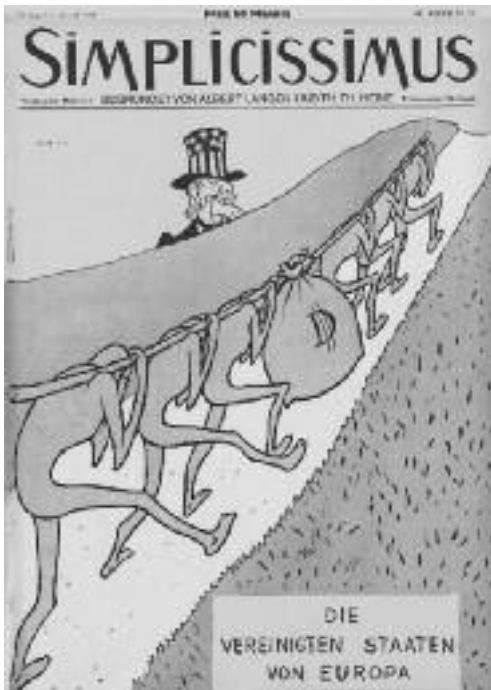
"Die Vereinigten Staaten von Europa", Th. Th. Heine, Simplicissimus , 34. Jahrgang Nr. 19, 1929

(Klaus Kastberger: Vorwort zu "Der ewige Spießer", Wiener Ausgabe, Band 14)