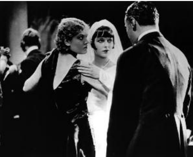
Hin- und hergerissen: Louise Brooks (Mitte) als Lulu in G. W. Pabsts Frank-Wedekind-Verfilmung "Die Büchse der Pandora" von 1929